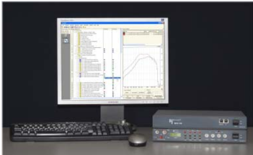
Analysesystem ACQUA mit TIA-810 Datenbank, MFE VIII 2 und MFE VI.1